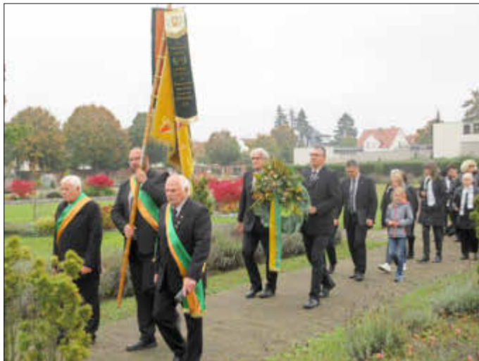
Gemeinsamer Gang zum Friedhofskreuz