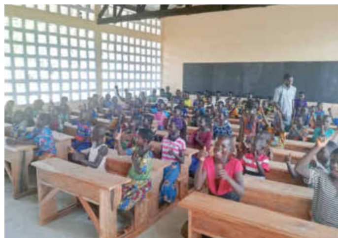
Schule und Klassenzimmer nach Fertigstellung Oktober 2021