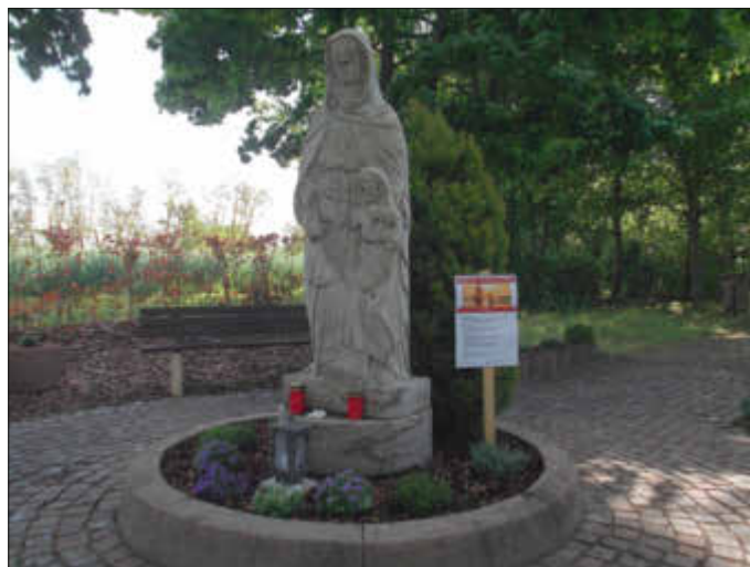
Wegimpuls an der Mutter-Anna-Statue

Die Gemeinde St. Anna nimmt mit 4 Impulsstationen an der o. g. Aktion der Pfarrei Hl. Theodard teil. Diese Stationen befinden sich an der Mutter-Anna-Statue (Friedhof), am Bildstöckel (Wald), am Kreuz in der Rülzheimer Straße/Birkenallee sowie an der Sitzbank an der Feldwegkreuzung Richtung Klostermühle Hördt in Nähe des Fernsendemastes.