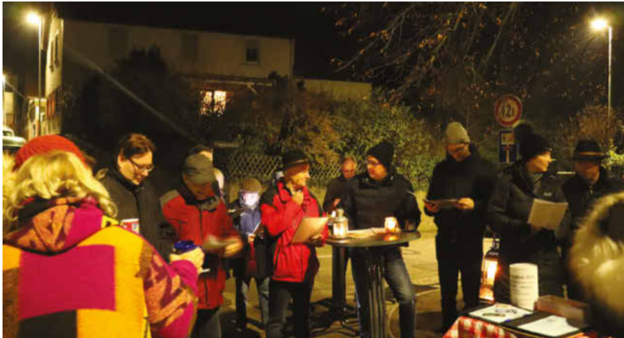
So war es 2019 bei den „Lebendigen Adventsfenstern“. In diesem Jahr muss das gemütliche Beisammensein wegen Corona leider ausfallen.