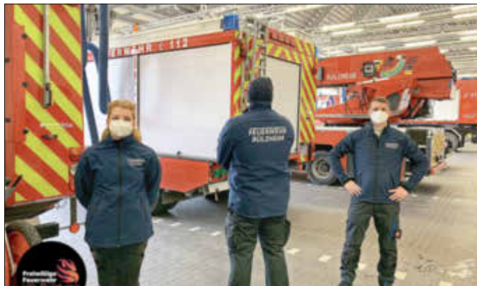
Die Softshelljacken von vorne und hinten. Es gibt sie in Frauen- und Männergrößen

Vielen Dank, das ist wirklich keine Selbstverständlichkeit und freut uns sehr! Die Wehrleute nutzen die Jacke zukünftig für Lehrgänge und dienstliche Veranstaltungen. Sie eignet sich aber auch hervorragend als Übergangsjacke in der Freizeit.