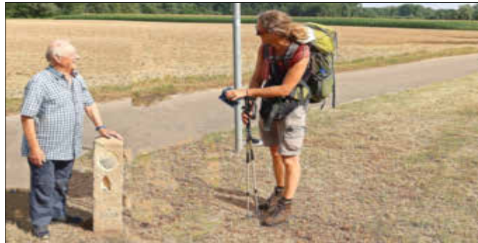
Pilgerin begeistert von Handwerkskunst