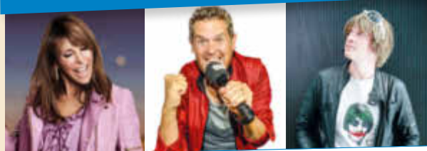
Ireen Sheer, Peter Wackel und Mickie Krause