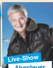
Live-Show Abenteuer Weltumrundung

Ausführlicher Reiseverlauf unter: www.schlager Nacht-namibia.de