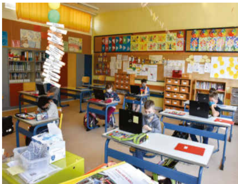
Lernen mit Abstand in der Grundschule Leimersheim. Die Masken haben die Kinder freiwillig auf, weil ihre Lehrerin zur Risikogruppe gehört und sie Rücksicht nehmen wollen.

Die Kinder erledigten die Aufgaben dann zuhause mit ihren Eltern, die Lehrerinnen der Grundschule standen dabei jederzeit für Fragen zur Verfügung. Korrekturen wurden in den ersten Wochen keine gemacht, denn das Kultusministerium habe vorgegeben, dass Kontaktvermeidung wichtiger sei als Korrekturen. Trotzdem: Die Kinder brauchten Rückmeldungen. Also ließ sich eine Lehrerin der vierten Klasse einmal die Woche die Aufgaben vorbeibringen, korrigierte sie und die Eltern konnten sie dann wieder ab-