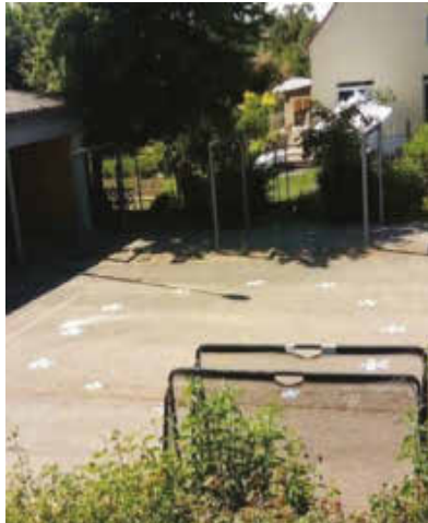
Ein Blumenkreis hilft den Schülern in den Pausen, den Mindestabstand einzuhalten.