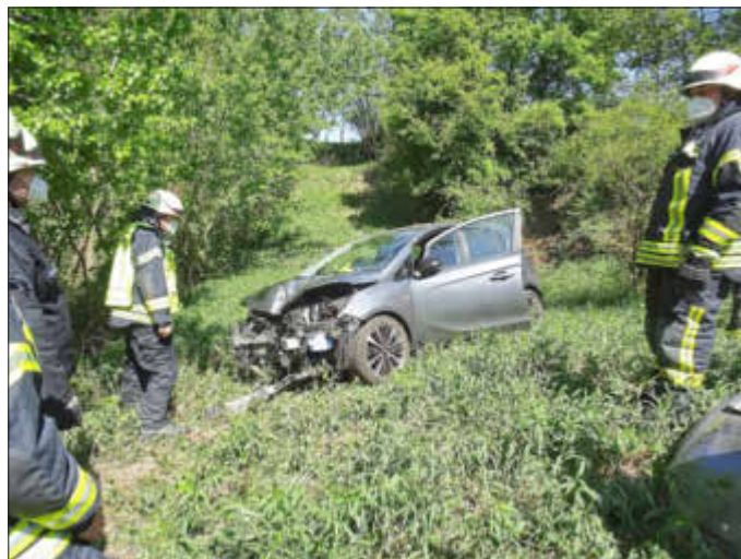
Unfall-PKW im unwegsamem Gelände

Herrn Egon Wolf am 11.05. zum 70. Geburtstag