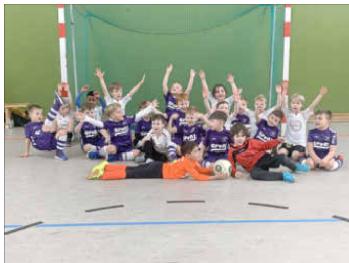
Bambinis SV Rülzheim und FV Neuburg/Berg SG

Am Samstag, den 8. Februar 2020 trafen sich die Bambinis des SV Rülzheim mit den zwischenzeitlich befreundeten Bambinis aus Berg in der Grundschulturnhalle Rülzheim. Das Motto des gemeinsamen Zusammentreffens war einfach nur Spaß haben. Nachdem die Kicker sich nach ein paar Spielen ausgepowert hatten, gab es eine kleine gemeinsame Stärkung bevor es voller Tatendrang zurück in die Halle ging. Vielen Dank an dieser Stelle an die gute Seele der Bambinis für ihr ständiges Engagement.