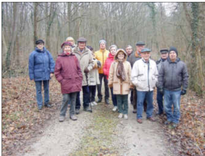
Beim Spaziergang im Hördter Wald