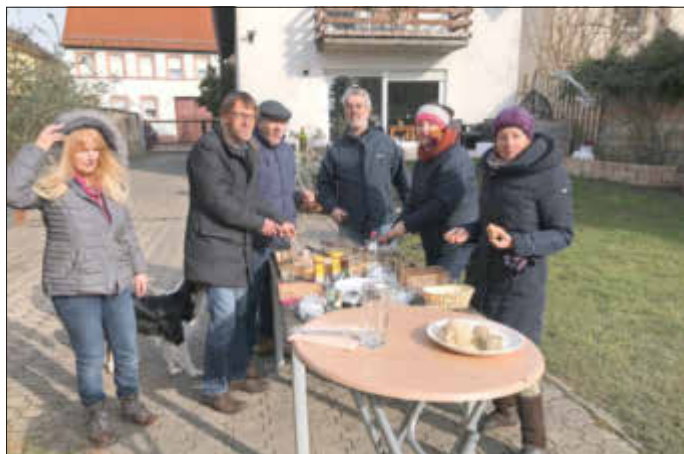
Ein Teil der Teilnehmer hat sich um den Tisch versammelt