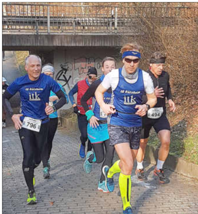
Das LG-Dreier-Team in der Unterführung nach Hatzenbühl