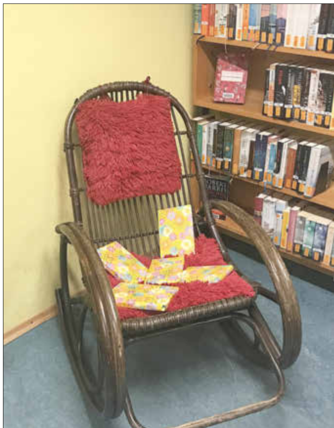
Die Buchpreise für die Gewinner liegen bereit.

Dienstag 16.30 Uhr – 18.30 Uhr, Donnerstag 18.00 - 19.30 Uhr